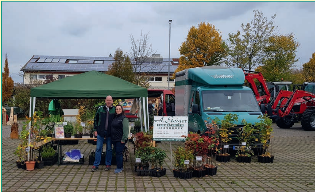
Holztag Scheinfeld 2022