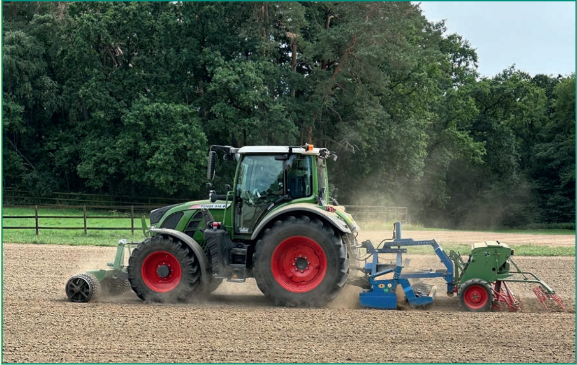
Aussaat - Zwischenfrucht